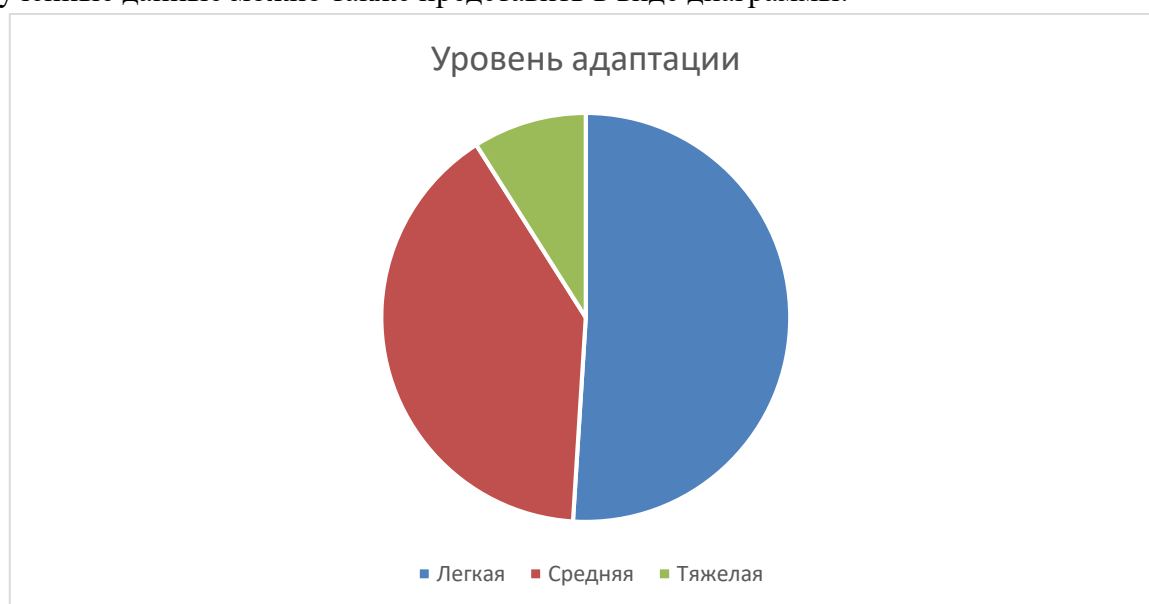
Диаграмма 1 - Уровень процесса адаптации детей к условиям детского сада

Полученные данные можно также представить в виде диаграммы: