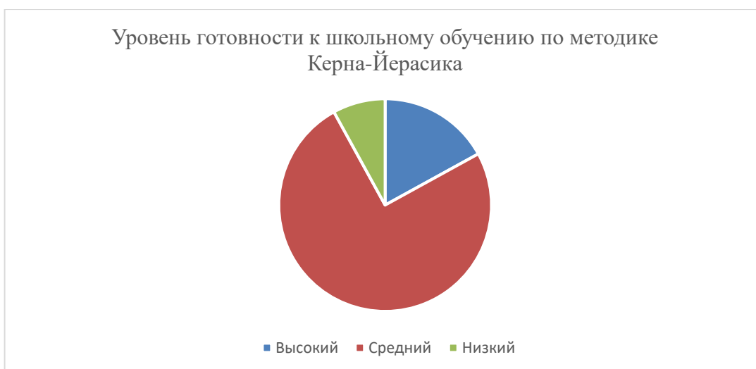
Диаграмма 2 – уровень готовности детей к школьному обучению по методике Керна-Йерасика на начало учебного года

По полученным данным проведённой психодиагностики можно сделать вывод, что 75% детей подготовительных к школе групп в начале учебного года имеют средний показатель школьной зрелости, что соответствует возрастной норме.