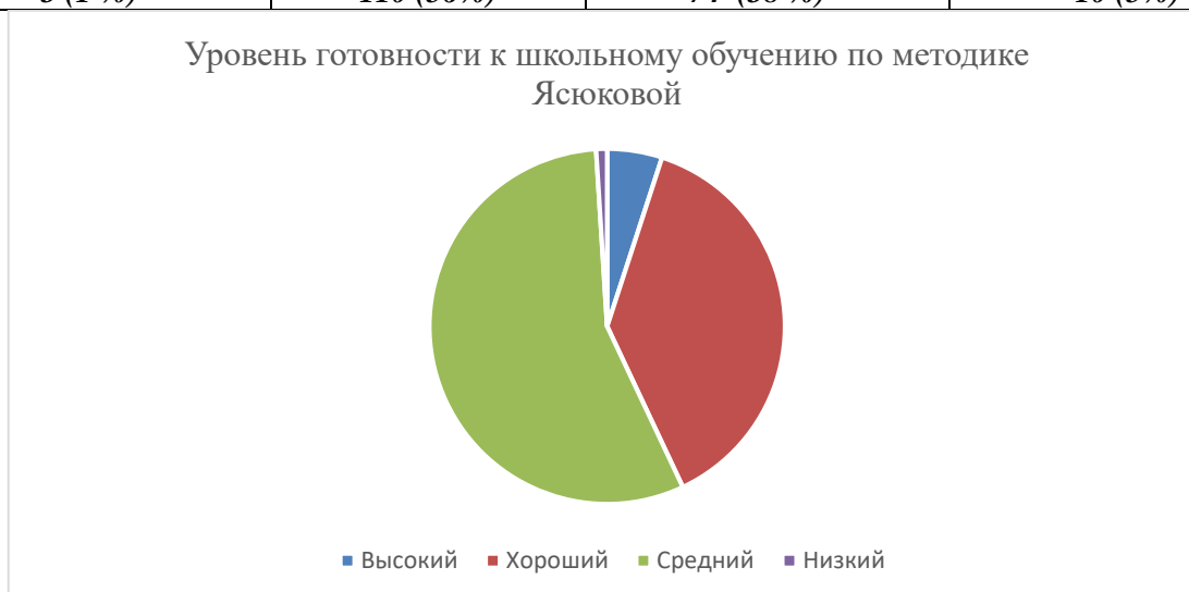
Диаграмма 5 – уровень готовности детей к школьному обучению по методике Л.А.Ясюковой на конец учебного года

Сравнивая результаты на начало и конец учебного года, можно сделать вывод о том, что «хороший уровень готовности к школе» увеличился на 1 %, средний уровень уменьшился на 7%, хороший уровень вырос на 1 %, а высокий на 4 при этом «низкий уровень готовности к школе» значительно снизился (на 7%).