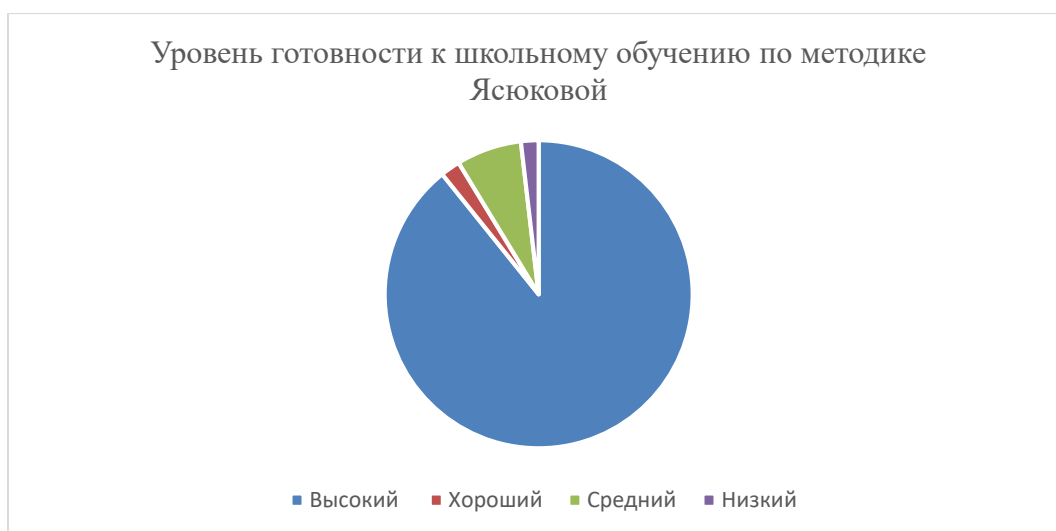
Диаграмма 3 – уровень готовности детей к школьному обучению по методике Л.А.Ясюковой на начало учебного года

По полученным данным проведённой психодиагностики можно сделать вывод, что 63% детей подготовительных к школе групп в начале учебного года имеют средний показатель готовности к школьному обучению, что соответствует возрастной норме. Хороший показатель готовности к школьному обучению у 19 % детей. Низкий уровень готовности к школьному обучению отмечен у 17 % детей. Высокий уровень готовности к школе составляет 1 % от общего числа воспитанников.