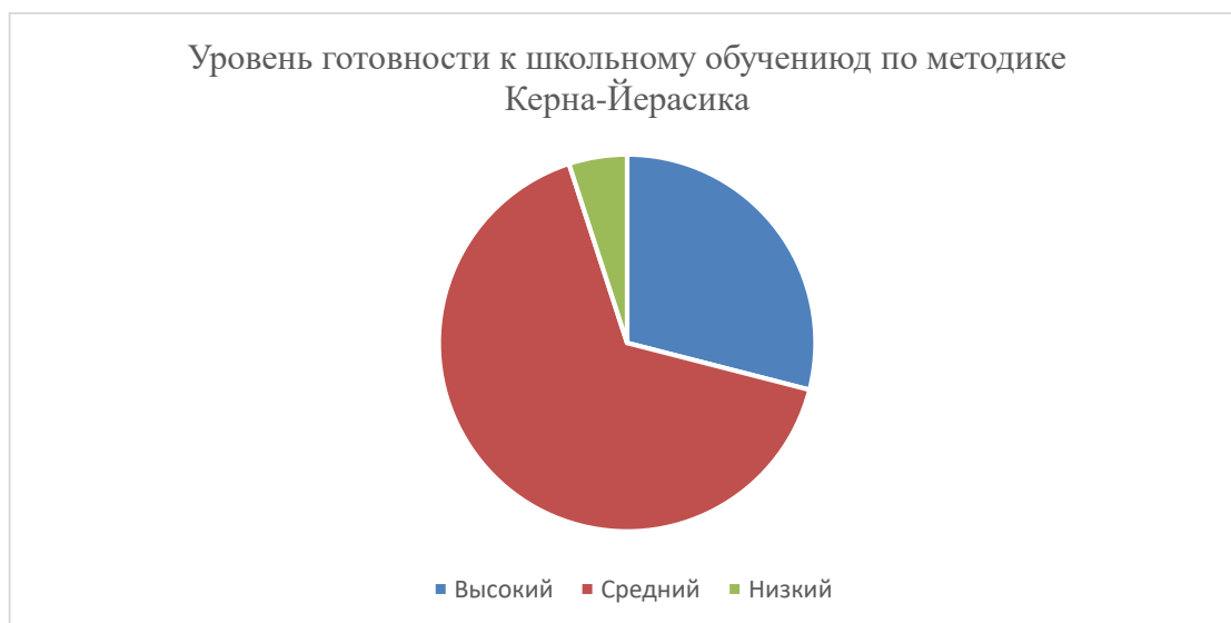
Диаграмма 4 – уровень готовности детей к школьному обучению по методике Керна-Йерасика на конец учебного года